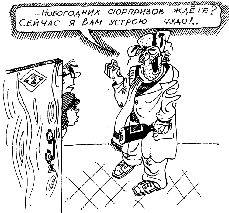
Рис. М. Смиренского

«Молилась ли ты на ночь, Дездемона?» — вспомнил Виктор Семенович слова гражданина Отелло, произнесенные им как раз в тот момент, когда разгневанный мнимой изменой своей подруги Мав-